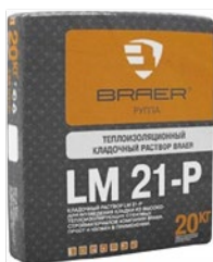
Теплоизоляционный кладочный раствор Braer LM 21