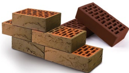
Цветной лицевой керамический кирпич