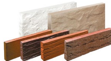
Фасадная и цокольная клинкерная плитка